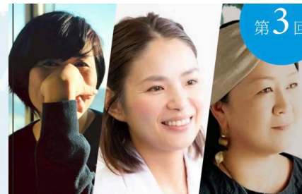
日本を変える 女性起業家たち